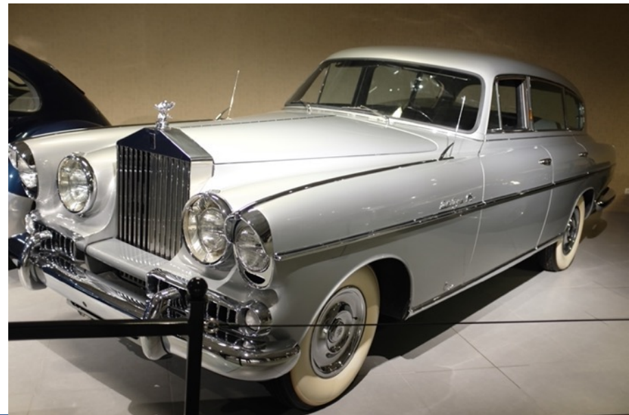
Een greep uit de collectie van het Louwman Museum