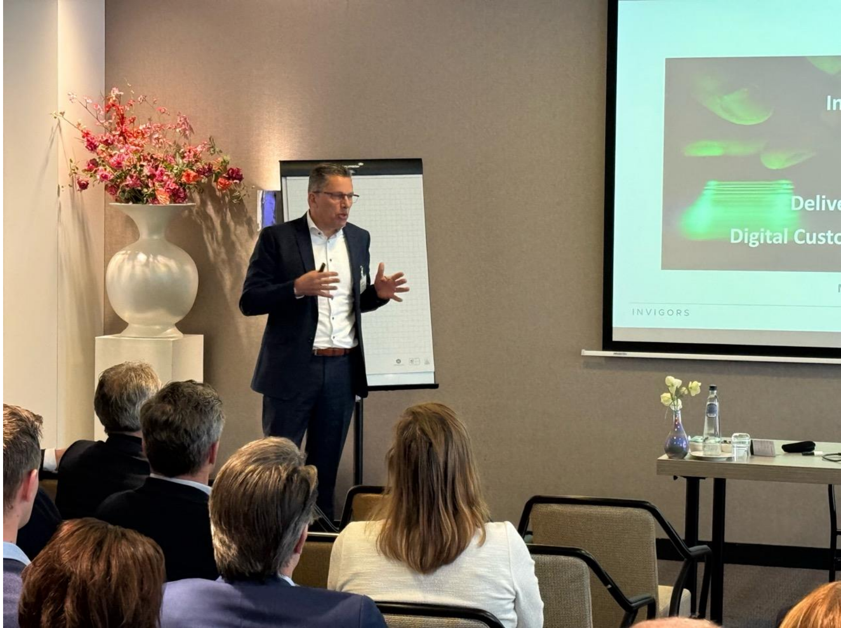
Hugo Aldering van Invigors Digital deelt zijn inzichten over excellente financiële dienstverlening